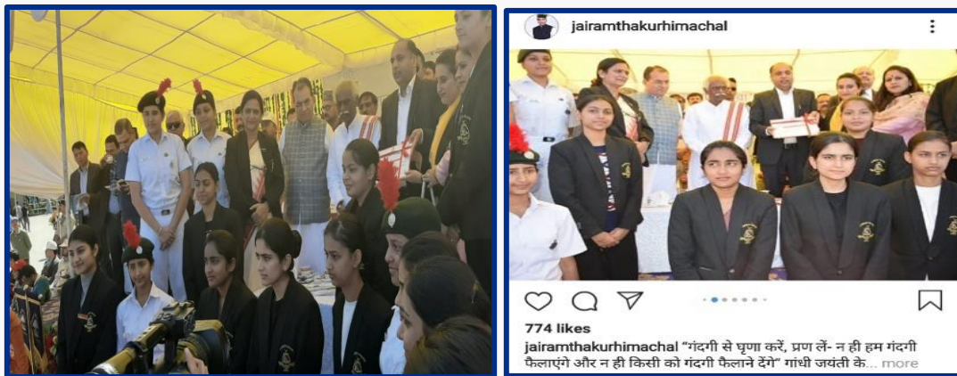
Workshop on Polybrick Initiative on (September 11, 2019)