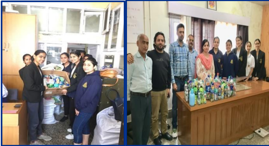
Workshop on Polybrick Initiative on (September 11, 2019)